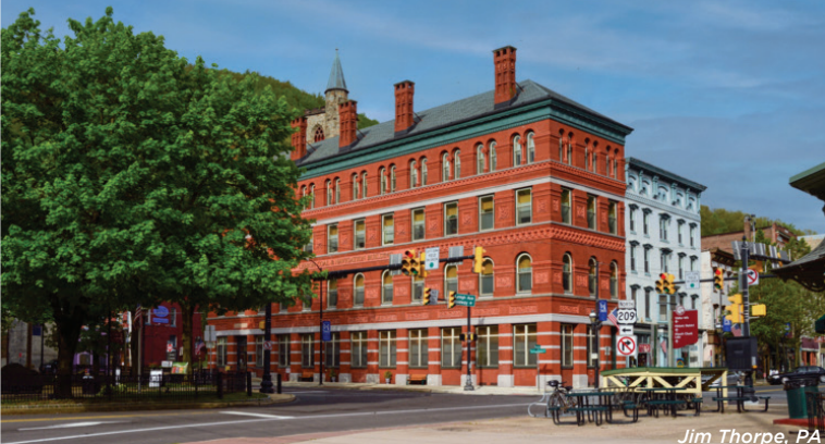
Jim Thorpe, PA

PBDA와 펜실베이니아 전역의 주민들과 함께 가족, 친구, 이웃을 위한 컴퓨터 접근 및 컴퓨터 기술을 홍보하십시오. 인터넷 연결은 우리를 하나로 묶어줍니다. 이 디지털 공정성 계획의 실행으로 모든 펜실베이니아 주민, 특히 소외 계층은 저렴한 고속 인터넷 연결, 일상적인 요구 사항을 충족하는 장치 및 디지털 기술에 액세스할 수 있게 됩니다. 디지털 자산의 개선은 모든 주민에게 이익이 됩니다.